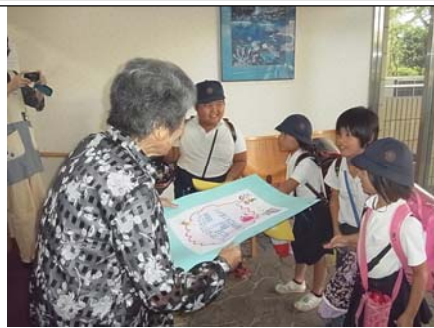
宇谷小学校の児童達が 運動会のお誘いに来ました。(2階玄関)